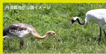
丹頂鶴自然公園イメージ