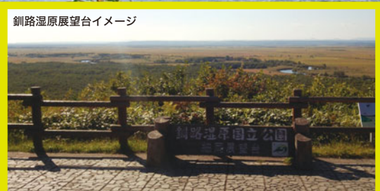
釧路湿原展望台イメージ